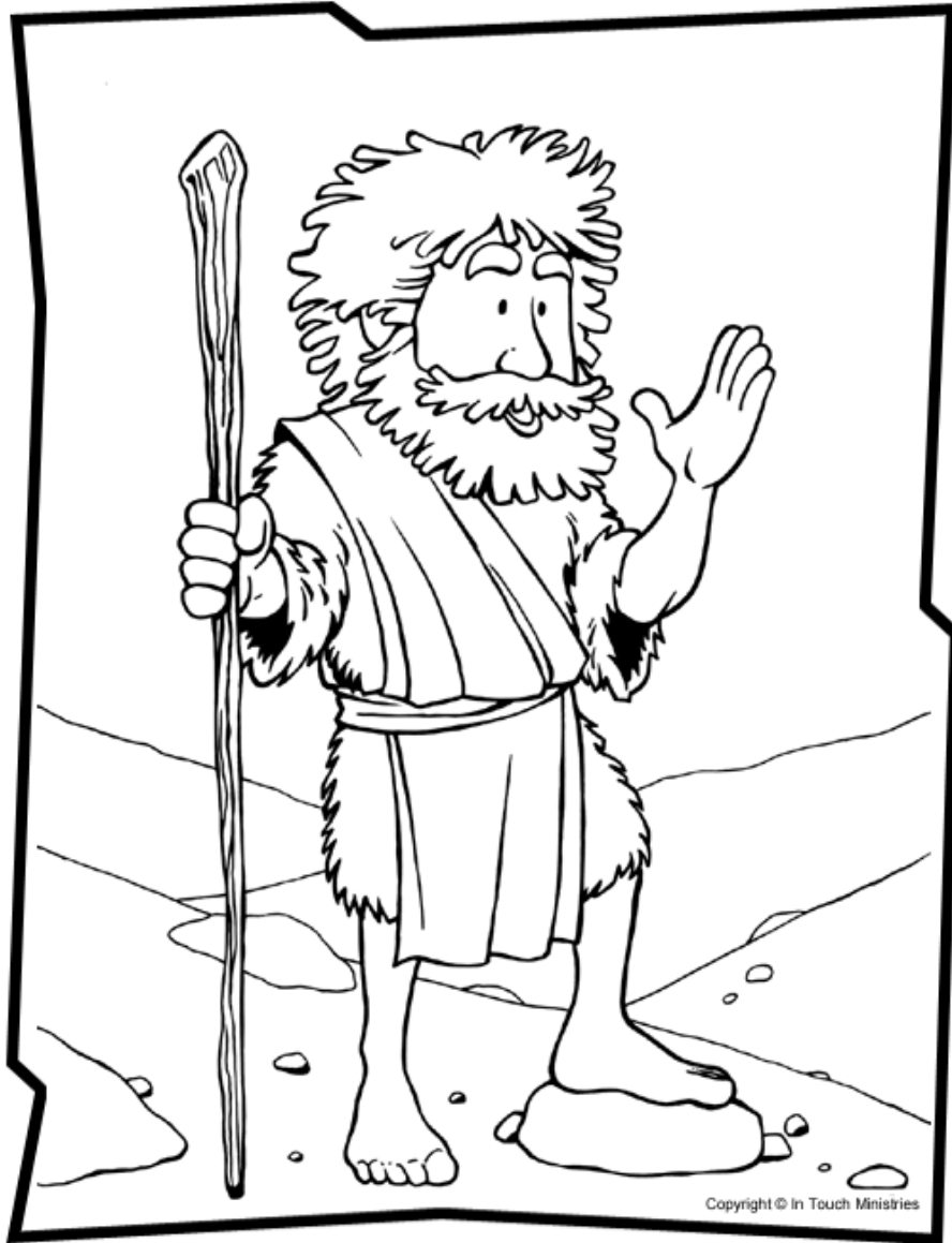
Juan el Bautista