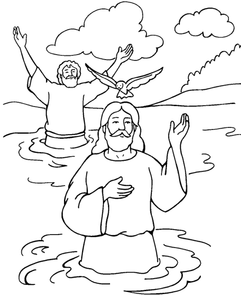
Juan bautiza a Jesús Mateo 3, Marcos 1, Lucas 3

Cada número representa una letra del alfabeto. Sustituye cada letra por el número correspondiente para resolver las palabras secretas.