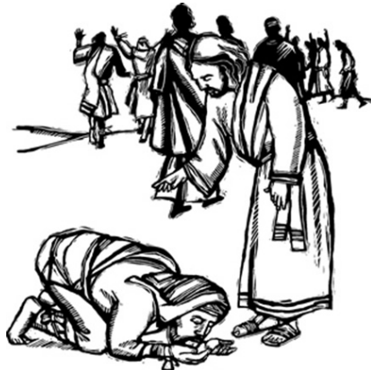
Jesús sana a diez leprosos