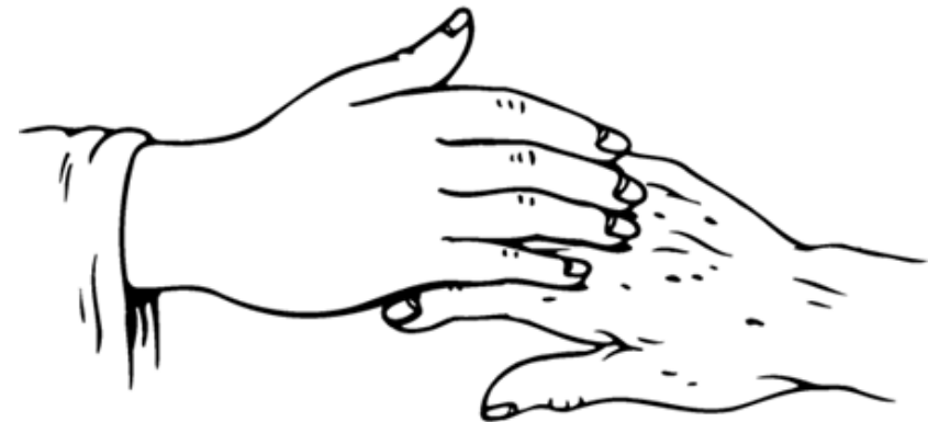
Jesús sana a diez leprosos